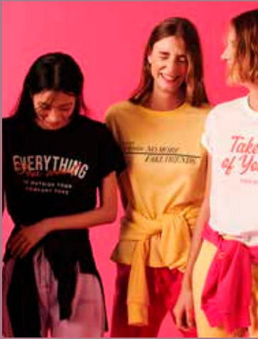
Nuestra Portada: Lefties SS22 "Colors"